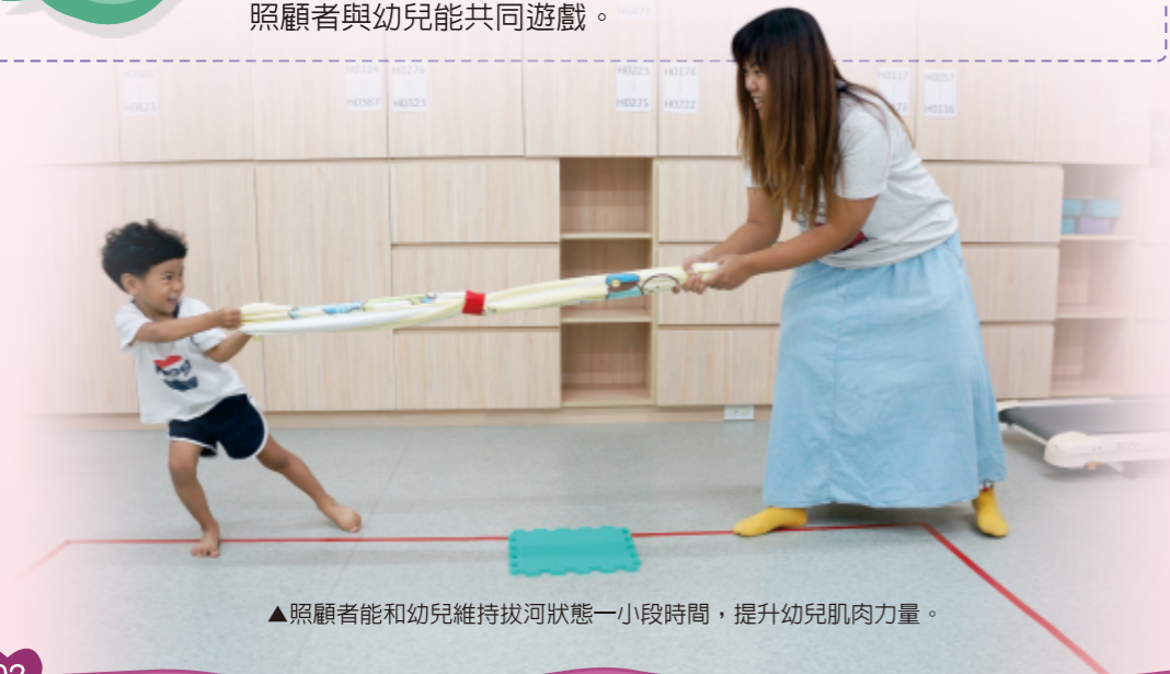
▲照顧者能和幼兒維持拔河狀態一小段時間，提升幼兒肌肉力量。

堅持度高的幼兒玩起比賽遊戲來，常會非勝利不可，堅持度低的孩子，做事情容易半途而廢或草草了事，照顧者不妨讓幼兒適時的體驗輸或贏，贏了給讚美，輸了給鼓勵，引導幼兒正向思考，重點在照顧者與幼兒能共同遊戲。