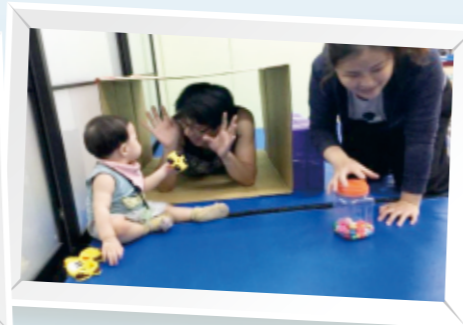
▲搭配會移動玩具，如：球、小汽車等，能讓幼兒爬得更起勁。