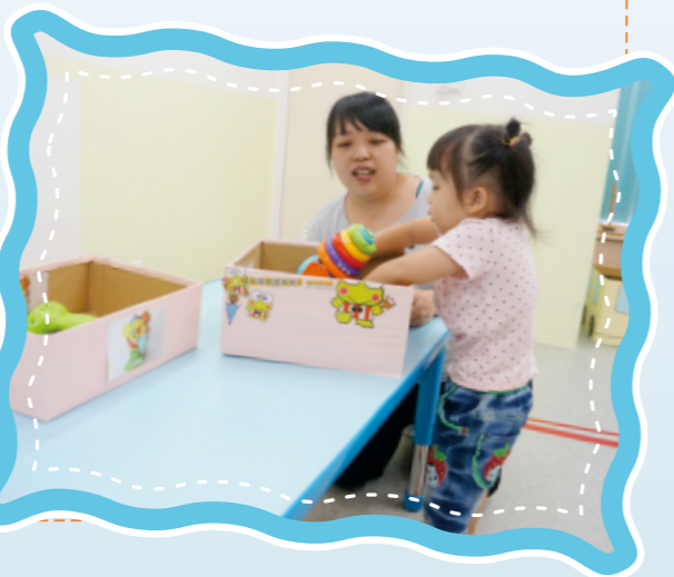
▲讓幼兒養成收拾的好習慣