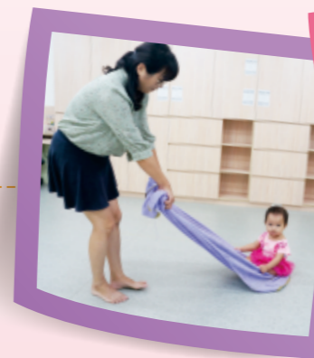
▲照顧者和幼兒面對面方式拉車，能觀察到幼兒表情，立即跟幼兒互動。