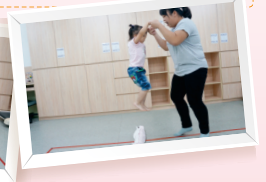
▲還不會向前跳的幼兒，照顧者可在前方牽著孩子的雙手，引導幼兒屈膝跳過毛巾捲。