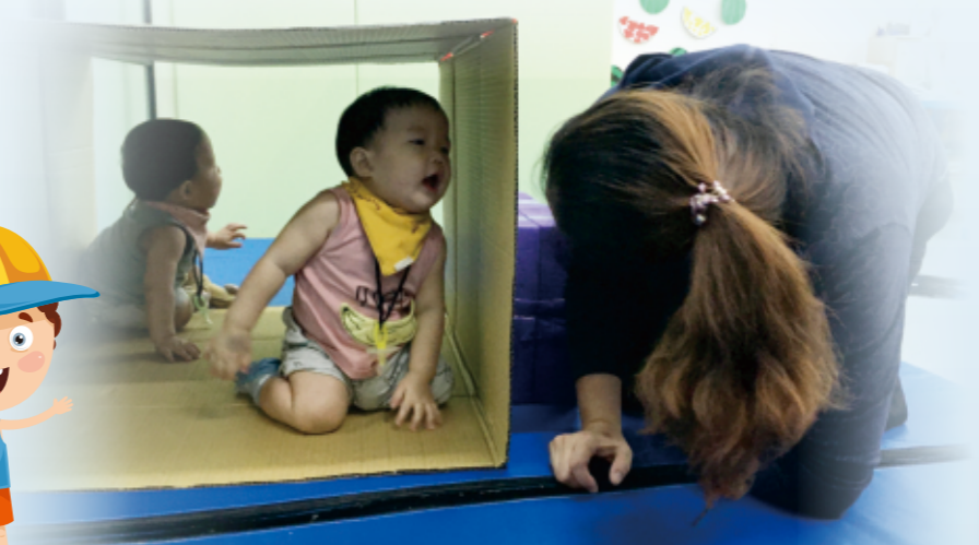
▲當幼兒找到時，照顧者立即開心興奮地說：「找到了！」更能增加趣味性。