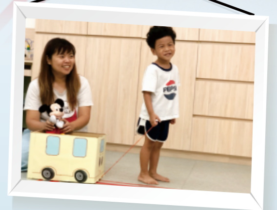
▲車子前方綁一條短繩就能讓幼兒載著喜愛的玩具走。