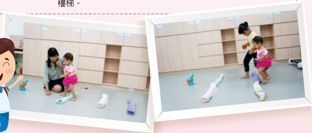
▲一邊放置玩具，讓幼兒跨越毛巾走過去放玩具。