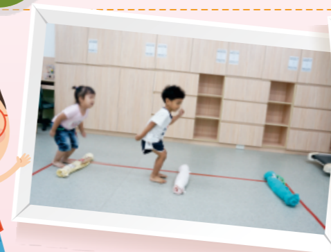
▲在適當範圍內排上2-3個毛巾捲，讓幼兒可以連續向前跳越障礙物。