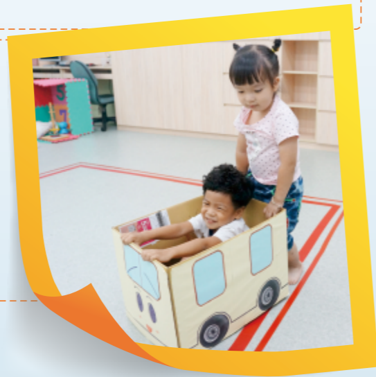
▲推著車子走，可以增加幼兒們的肌肉力量。