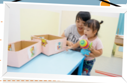
▲照顧者引導幼兒找玩具的照片