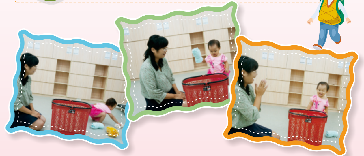
▲家長可以先示範一邊講一邊做的方式，讓幼兒了解玩法，完成後別忘了給幼兒鼓勵喔！