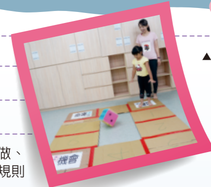
▲照顧者和幼兒一起練習排隊、輪流擲骰子和跳格子。