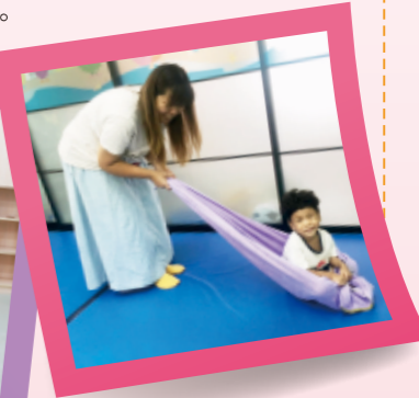
▲讓幼兒倒著坐拉車，也很好玩。