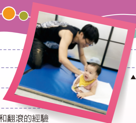
▲幼兒躺在毛巾短邊一側，照顧者協助幼兒側翻滾將毛巾捲在幼兒身上。