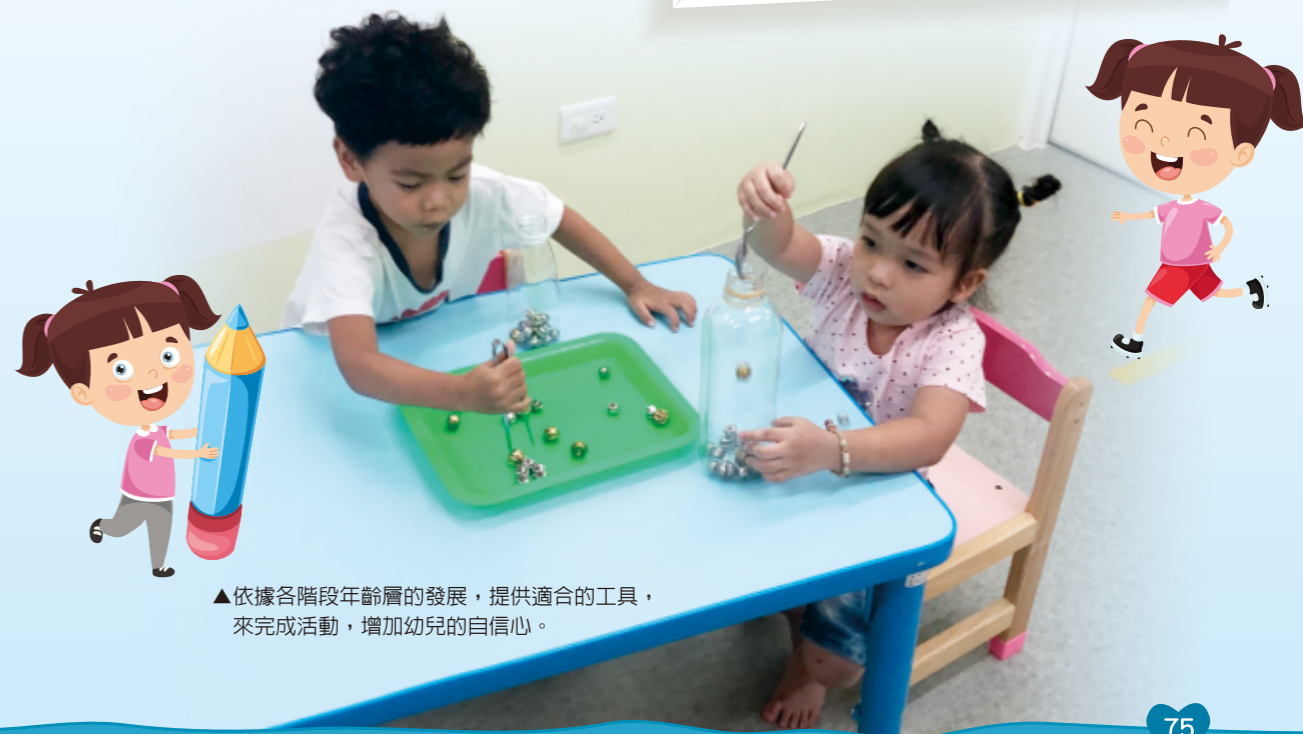
▲依據各階段年齡層的發展，提供適合的工具，來完成活動，增加幼兒的自信心。