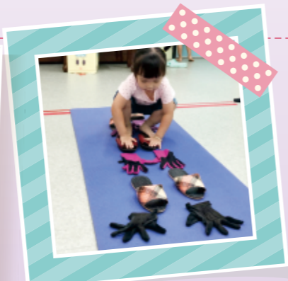
▲將家裡手套與拖鞋排列成直線，引導幼兒將其手腳放在手腳印上，依指令活動，也可自製手足印來玩喔！