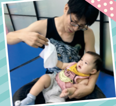
▲在距離幼兒眼前20-90公分展示小方巾