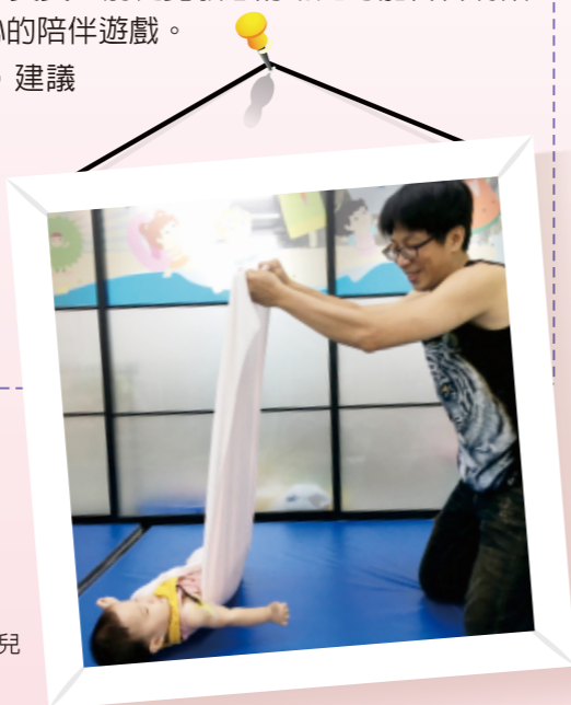
▲緩慢的拉高毛巾，讓幼兒安全的側翻滾。