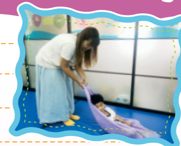
▲較易緊張或年紀較小的幼兒，可讓幼兒躺在毛巾上試著感受毛巾移動的感覺。