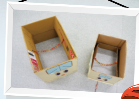
▲用橡皮筋繩讓孩子掛在身上，能讓幼兒能輕易的帶著車子走。