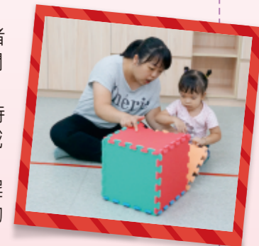
▲照顧者引導幼兒打開大方塊，並詢問：「是什麼呢？」，建議等待一下，看幼兒能不能主動說出物品的名稱。