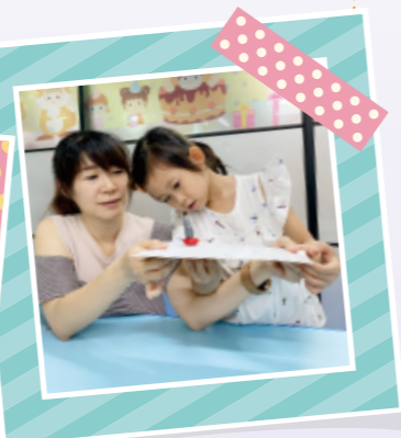
▲幼兒拿著迷宮圖，讓幼兒移動磁鐵讓貓咪玩偶走到終點。