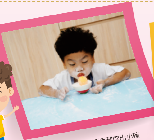
▲幼兒試著將乒乓球吹出小碗