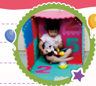
▲2歲以上的幼兒，照顧者可以引導幼兒挑選喜歡的物品佈置自己的秘密城堡。

在適合幼兒活動的安全區塊內選擇一個角落，利用巧拼墊拼出一個能夠讓幼兒自由進出的空間，做為秘密城堡；引導幼兒挑選喜歡的玩偶或抱毯放入該空間。