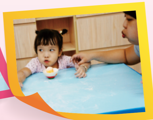
▲照顧者示範「嘟嘴吹氣」的動作