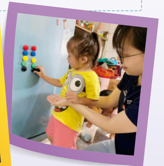
▲照顧者引導幼兒使用磁鐵排列成一樣的彩虹毛毛蟲。