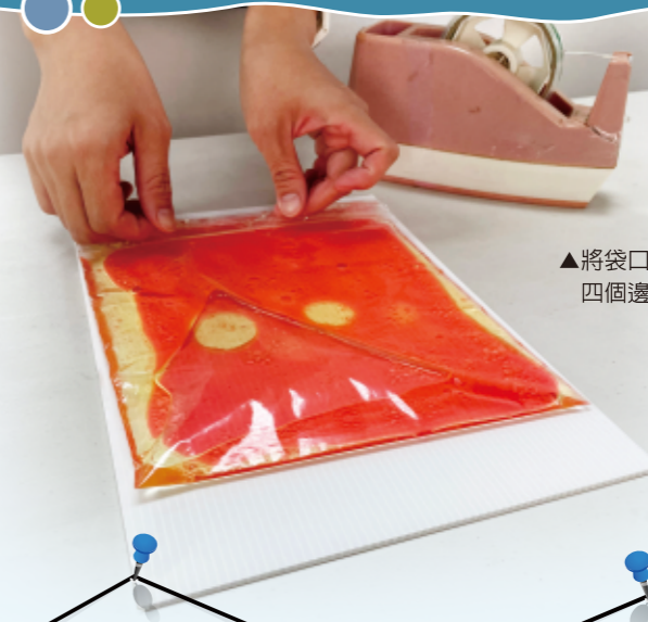
▲將袋口反折，使用膠帶將四個邊貼住預防漏水。