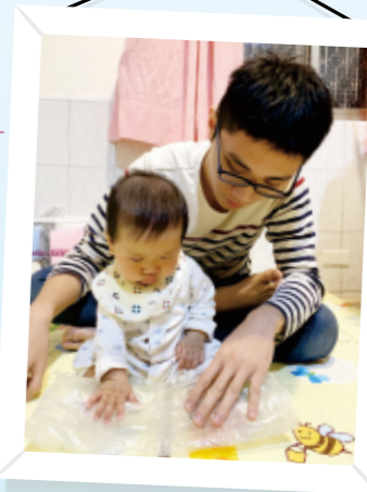
▲照顧者與幼兒一起拍氣泡紙，製造出好玩的聲音與觸覺。