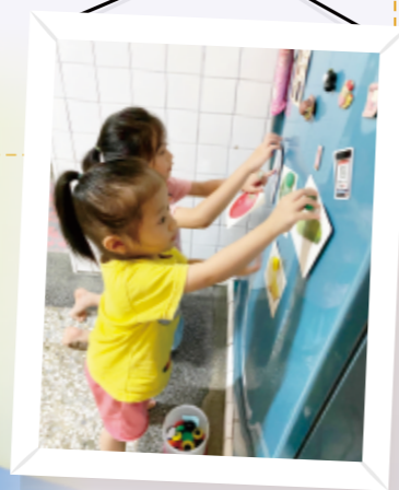
▲請幼兒雙手合作將卡片、報紙用磁鐵吸在冰箱上。