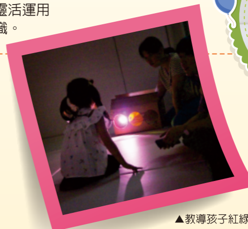
▲教導孩子紅綠燈的燈號