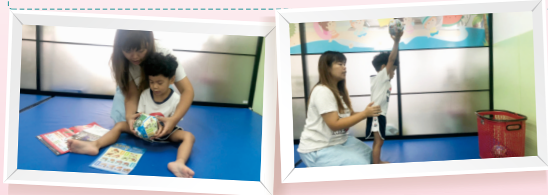
▲利用「捏捏小飯糰」的方法，一層又一層加上廣告單，變成大紙球；結合洗衣籃玩投籃遊戲。