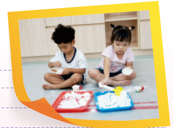
▲在鋪好養生膠帶的地板上玩麵粉

可先從小份量讓幼兒嘗試，照顧者可先舀出一小杯麵粉，引導幼兒摸、戳、抓和抹；待幼兒熟悉後，再引導幼兒自己拿小湯匙和小碗舀麵粉和倒出來。