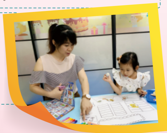
▲照顧者剪下商品，孩子讓商品上架；一起討論商品擺放的位置，完成屬於自己的商店喔！