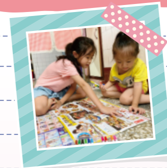
▲手足們輪流出題找物品，促進互動及溝通能力。