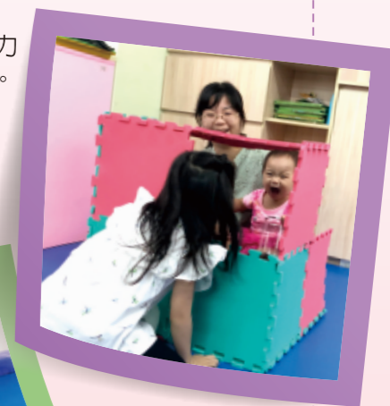
▲2歲以內的幼兒照顧者可以利用互動遊戲的方式（如躲貓貓）讓幼兒熟悉這個秘密角落。