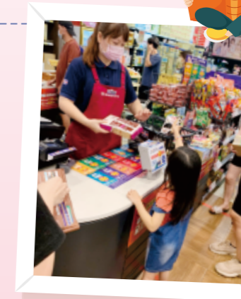
▲藉由事前討論的清單，讓幼兒到超市採購商品。