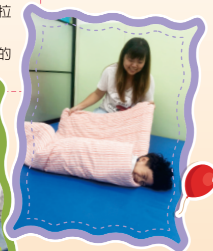
▲將幼兒包裹在棉被裡，再用力拉開，讓幼兒用翻滾的方式出來。