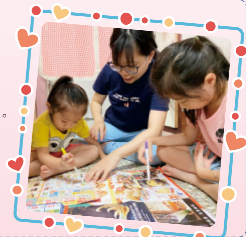
▲照顧者發號司令、手足來比賽，看誰先找出廣告單的物品。