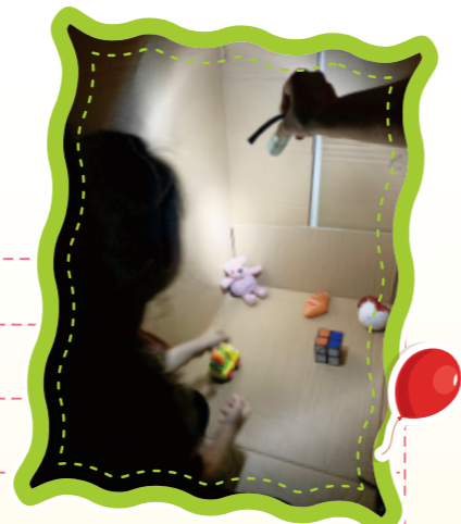
▲跟隨手電筒照射區域移動