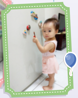
▲冰箱上的可愛磁鐵，吸引幼兒用手抓握、或者手指前端擱起磁鐵。