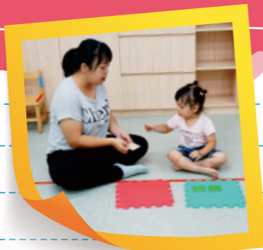
▲照顧者引導幼兒抽卡片