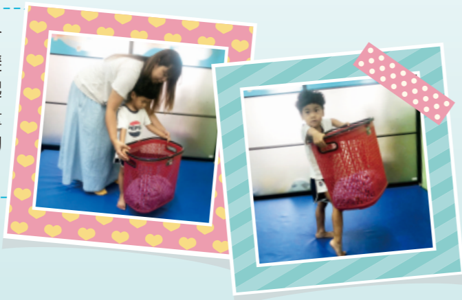
▲提示幼兒將雙手放洗衣籃旁邊，以方便抓握使力，再提起洗衣籃。