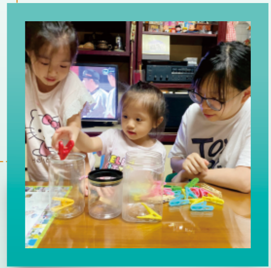
▲提供幾個透明的盒子，讓幼兒進行夾子分類，誘發細部差異的觀察能力。