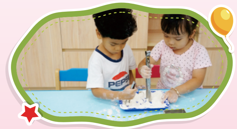
▲幼兒使用不鏽鋼夾尋找藏在麵粉中的錢幣