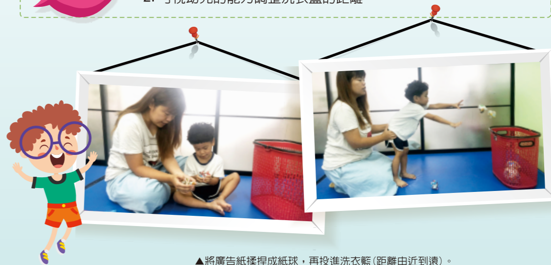
▲將廣告紙揉捏成紙球，再投進洗衣籃(距離由近到遠)。