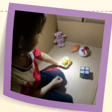
▲找到手電筒照射到的物品