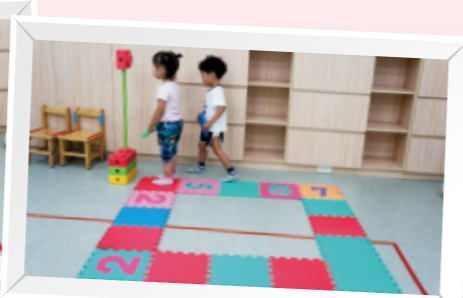
▲遵守交通規則，紅燈停、綠燈行。