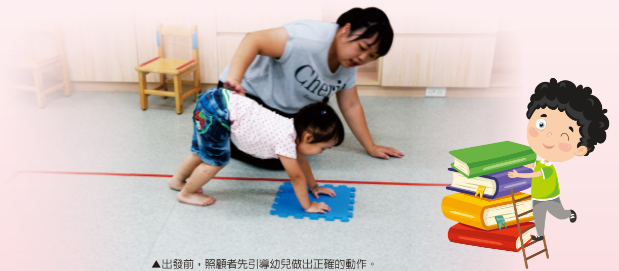
▲出發前，照顧者先引導幼兒做出正確的動作。