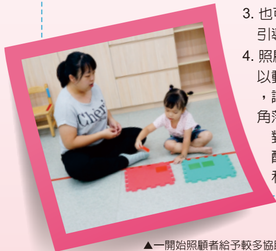
▲一開始照顧者給予較多協助，多次練習後，照顧者漸漸減少協助，觀察幼兒能不能自己完成顏色配對。