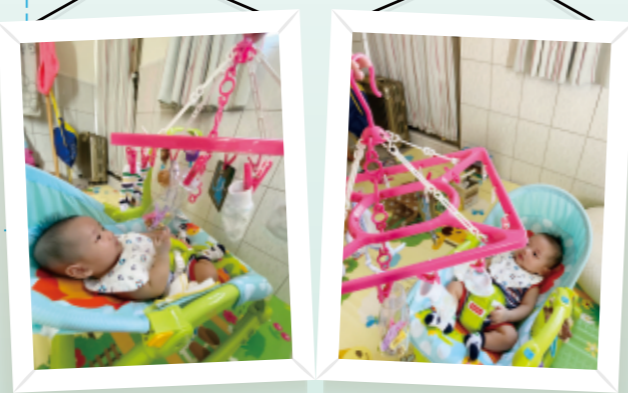
▲夾取的物件可隨時更換，也可將寶寶圖卡(例如黑白圖卡)夾於上面。