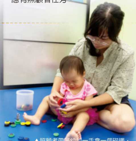
▲照顧者帶著幼兒一手拿一個磁鐵，「喀」一聲讓磁鐵吸在一起。