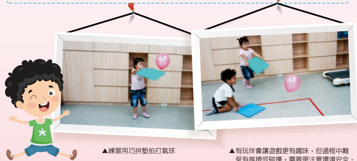
▲練習用巧拼墊拍打氣球