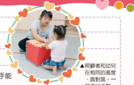
▲照顧者和幼兒在相同的高度、面對面，一起進行活動。

照顧者準備幾項日常用品做為題目，如：水杯、鞋子、手套、梳子、乳液等，或是幼兒喜歡的玩具（玩偶、玩具車）。用六片巧拼墊組成立體的大方塊，並將其中一項物品藏於其中，照顧者帶著幼兒一起搖一搖大方塊、感覺物品的重量、聆聽搖晃時發出的聲音，說：「裡面有什麼呢？」，再帶著幼兒打開方塊：「是_____。」