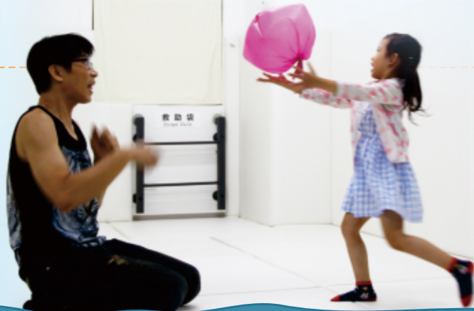
▲將塑膠袋球拋至空中，並引導幼兒向上拍擊使其不掉落地面。