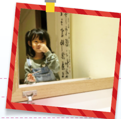
▲在鏡子前將豆豆貼貼於臉上，引導幼兒將五官部位的貼紙拿下，並說出部位名稱。