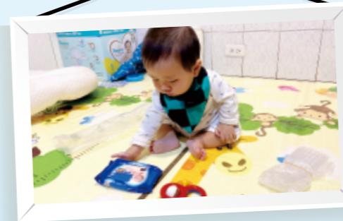
▲遊戲時間，讓幼兒自由移動去找好玩的素材，可以增加幼兒探索和移動能力喔！